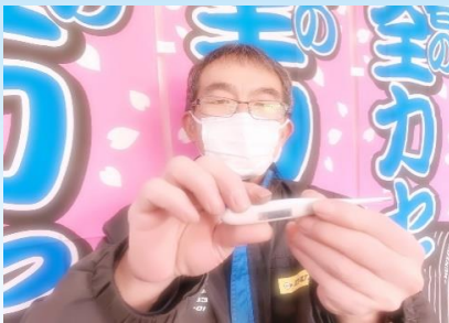
マスクの直用、営業前に体温測定

この度、新型コロナウイルスの感染拡大が発生しておりますが、 当店といたしましてもウィルスの感染拡大の防止と、お客様及び従業員の 安全確保を目的に以下の対策及び徹底を実施しております。