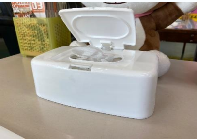
テーブルの上にウェットティッシュを配置 ご自由にお使いください