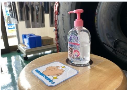
店舗入口では手指のアルコール消毒ができます