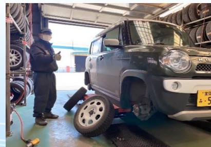
風通しのよいピット室での作業