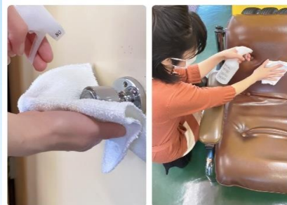
定期的な除菌(手が触れるドアノブ・イスなど)