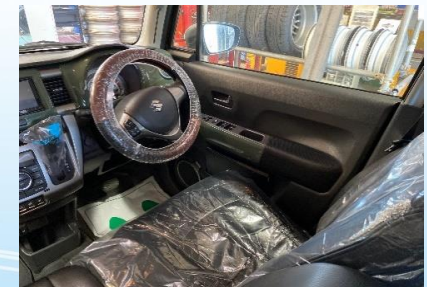
車内を整備シートで養生 窓は3cm程度開きます