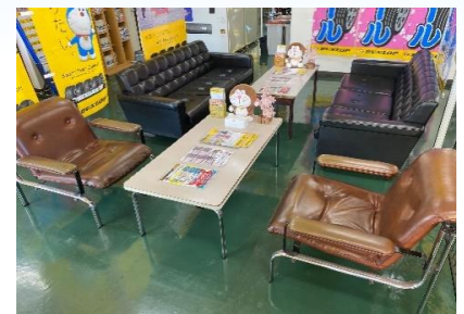
座席は間隔をあけて配置